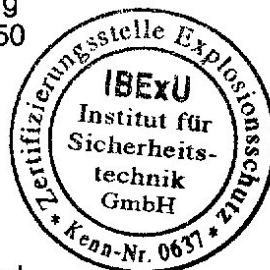
- Siegel - (Kenn-Nr. 0637)